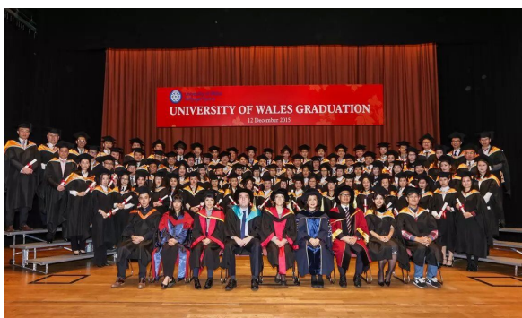
记录下人生中其中一个光辉灿烂的回忆

英国威尔士大学的工商管理硕士课程，旨在培育在职专业人士及行政管员，提供企业团体成员之学术和管理水平，从多角度面对及剖析全球商业竞争环境的挑战，获颁发的硕士学历，其学术水平与地位及认受性与英国大学本部硕士学位课程完全相同。