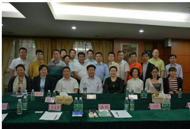
中国中小企业协会 李子彬会长受国务院委托来深圳调研中小企业

出席开会的领导分别有中国中小企业协会李子彬会长、深圳中小企业发展促进协会孙利会长、深圳中小企业发展署冯副署长等。